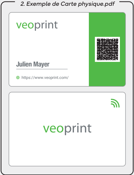
2. Exemple de Carte physique.pdf